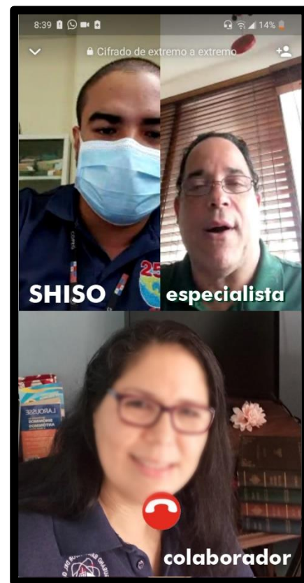
Se ofrecieron consultas psicológicas virtuales para todo el personal.