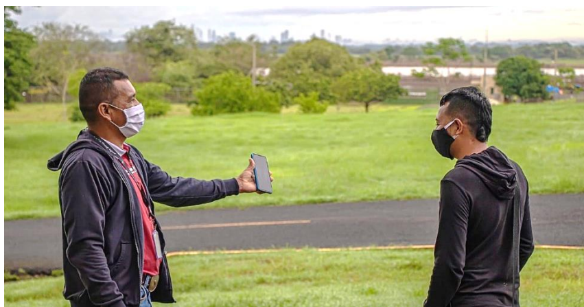
Colaboradores de COPEG socializan teniendo en cuenta las nuevas normas de distanciamiento social.