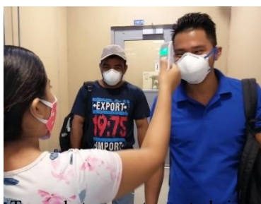
Toma de temperatura a trabajadores, empleadores, proveedores y visitantes