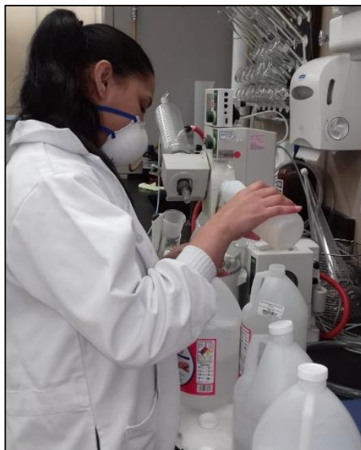
Control de Calidad prepara gel alcoholado para toda la Organización.