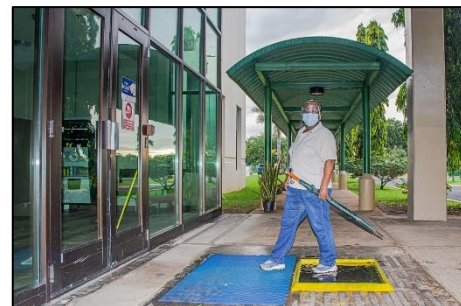
Utilización de tapetes sanitarios